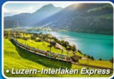
• Luzern-Interlaken Express