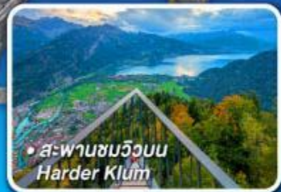
• สะพานชมวิวน Harder Klum