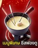
เมนูพิเศษ ชีสฟองดู

2 ยอดเขาที่สวยงามที่สุด Jungfrau และ Matterhorn รวมตั๋วรถไฟ Glacier Express และ Gornergrat train เมืองมอเทอ ปราสาคิลยอง เวเวย์ รูปีนชาร์ลี แซปลิน โลซาน ศาลาไทย เมริน เมืองมรดกโลกของสวิส ลูเซิร์น สะพานไม้ชาเปล ลิงโตสะอื่น ทะเลสาบสิมรกต เบลาค