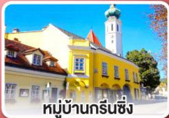
หมู่บ้านกรีนซิง