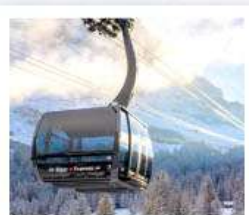
ขึ้นกระเช้ายอดเขาจุงเฟรา