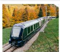
รถไฟโกลเด้นพาส