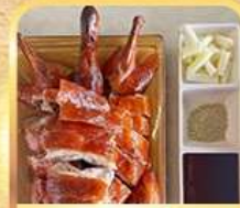
เบ็ดปักกิ้ง