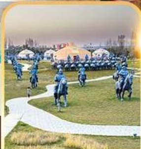
สวนเจงกิสข่าน