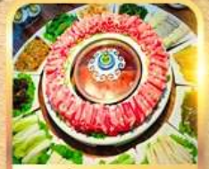
สุกี้สไตล์มองโก