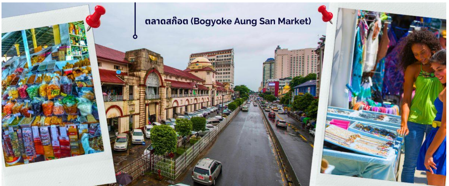
ตลาดสก๊อต (Bogyoke Aung San Market)

ให้ท่านได้มีเวลากับการเลือกซื้อของฝาก ของที่ระลึกต่างๆ ทั้งสินค้าพื้นเมืองที่มีชื่อเสียงของพม่าที่ ตลาดสก๊อต (Bogyoke Aung San Market) นี่คือนตลาดที่ใหญ่ที่สุดในย่างกุ้ง เป็นแหล่งช้อปปิ้งที่มีสินค้าวางขายแทบทุกชนิด เปรียบเสมือนตลาดนัดจตุจักรของบ้านเราก็ดำเนินได้ นอกจากสินค้าพื้นเมืองแล้ว ตลาดแห่งนี้ยังเป็นแหล่งรวมสินค้าประเภทอัญมณีที่เป็นที่รู้จักไปทั่วโลกนั่นคือ หยกพม่า (หากซื้อสินค้าหรืออัญมณีที่มีราคาสูง ควรขอใบเสร็จรับเงินทุกครั้ง เนื่องจากจะต้องแสดงให้เจ้าหน้าที่ศุลกากรหากมีการขอตรวจสอบ)