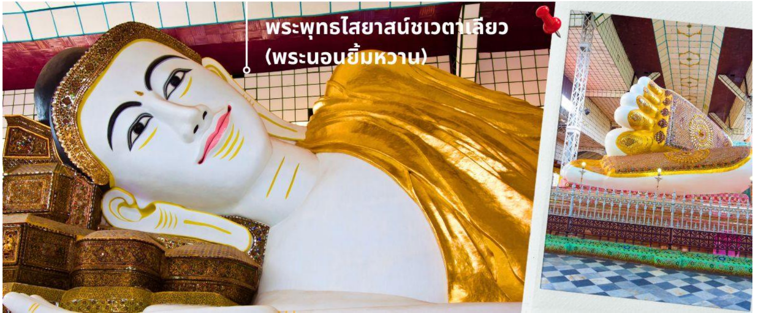
พระพุทธรไสยาสน์ชเวตาเลียว (พระนอนยิ้มหวาน)

ไม้แกะสลัก ที่มีให้เลือกมากมาย ตลอดสองข้างทางที่จะเดินเข้าไปสักการะองค์พระนอน และสินค้าพื้นเมือง อื่นๆ อาทิเช่น ผ้าพม่า ของที่ระลึกต่างๆอีกมากมาย