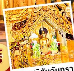
พระสุริยอินจันตรา