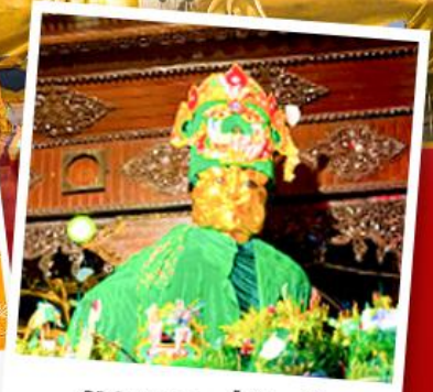
ขอพรแม่ยักษ์