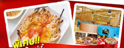
พิเศษ!! ก๊วยแม่น้ำ + HOTPOT SEAFOOD