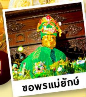
ขอพรแม่ยักย์