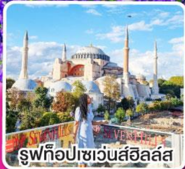
รูปทิวลิปเซเว่นสีฮิลล์