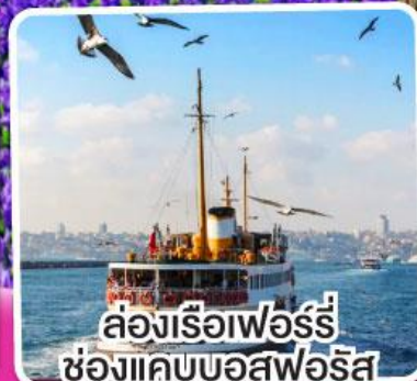
ล่องเรือเฟอร์รี่ ช่องแคบบอสฟอรัส