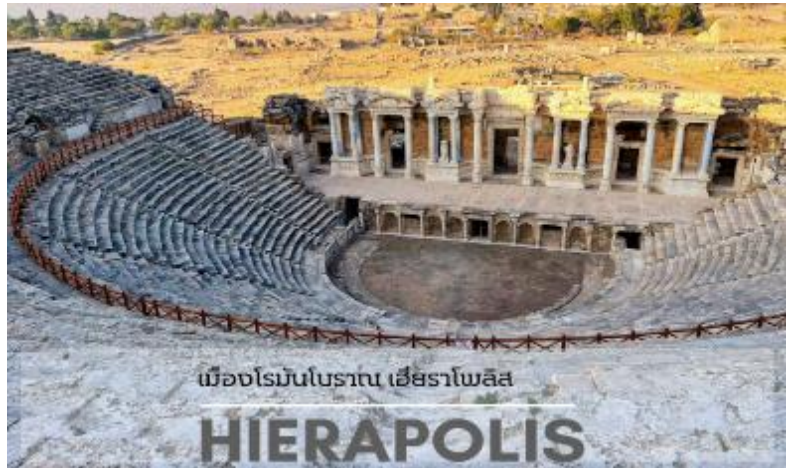
เมืองโรมันโบราณ เฮียราโพลิส

(HIERAPOLIS) เมืองโรมันโบราณที่สร้างล้อมรอบบริเวณที่เป็นน้ำพุเกลือแร่ร้อนซึ่งเชื่อกันว่ามีสรรพคุณในการรักษาโรคเมื่อเวลาผ่านไปภัยธรรมชาติได้ทำให้เมืองนี้เกิดการพังทลายลงเหลือเพียงซากปรักหักพังกระจายอยู่ทั่วไป เช่น โรงละครแอมฟิเธียเตอร์ขนาดใหญ่ วิหารอพอลโล สุสานโรมันโบราณ