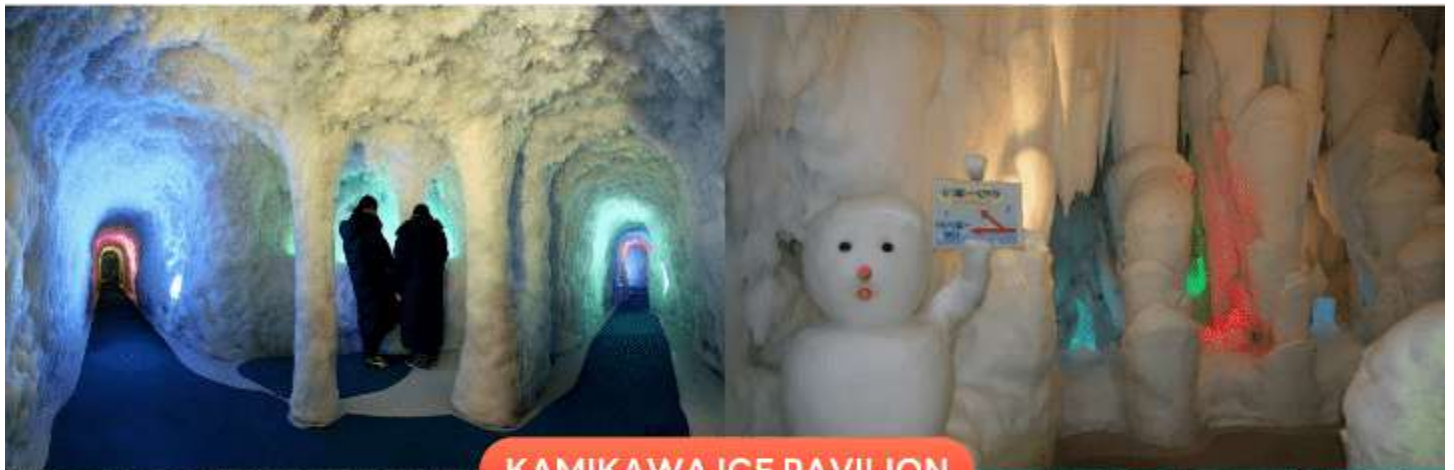
KAMIKAWA ICE PAVILION

จากนั้นนำท่านเดินทางสู่ เมืองคามิดาวะ (Kamikawa) เป็นเมืองที่ตั้งอยู่ในจังหวัดฮอกไกโด โดดเด่นด้วยธรรมชาติอัน อุดมสมบูรณ์ โดยเป็นประตูสู่อุทยานแห่งชาติไดเซดสิซัง เพื่อนำท่านสัมผัสประสบการณ์ความหนาวสุดขีดที่ พิพิธภัณฑ์ หิมะและน้ำแข็งคามิดาวะ (Kamikawa Ice Pavilion) ดินแดนแห่งโลกน้ำแข็งที่เปิดให้เข้าชมได้ตลอดทั้งปี ภายในจัด แสดงอุโมงค์น้ำแข็ง และเสาน้ำแข็งขนาดใหญ่ที่ถูกเก็บรักษาไว้ในอุณหภูมิต่ำประมาณ -20 องศาเซลเซียส สร้างบรรยากาศ ราวกับหลุดเข้าไปอยู่ในอาณาจักรน้ำแข็งสุดมหัศจรรย์ พร้อมชมปรากฏการณ์ “Diamond Dust” เกิดน้ำแข็งระยิบระยับ ที่ส่องประกายงดงาม และทดลองสัมผัสอุณหภูมิต่ำสุดถึง -41 องศาเซลเซียส ซึ่งเป็นสถิติอุณหภูมิต่ำสุดที่เคยบันทึกได้ใน ประเทศญี่ปุ่น อีกทั้งยังมีกิจกรรมสุดพิเศษ เช่น การทดลองผ้าขนหนูแข็งตัวในพริบตา และมุมถ่ายภาพสวยงามมากมาย ให้ทุกท่านได้เก็บภาพความประทับใจท่ามกลางโลกแห่งความเย็นเยือกที่หาได้ยากจากที่อื่น