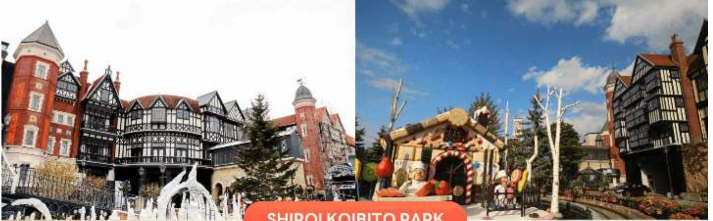
SHIROI KOIBITO PARK