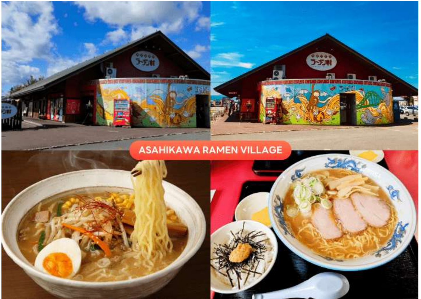
ASAHIKAWA RAMEN VILLAGE

นำท่านเดินทางกลับสู่ เมืองอาซาฮิดาว่า (Asahikawa) เพื่อนำท่านสู่ หมู่บ้านรามเมนาอาซาฮิดาว่า (Asahikawa Ramen Village) แหล่งรวมรามเมนเจ้าดังของเมืองอาซาฮิดาว่า ที่คัดสรรร้านยอดเยี่ยมไว้ถึง 8 ร้านในที่เดียว เพลิดเพลินกับการลิ้มลองรามเมนสูตรต้นตำรับฮอกไกโด สไตส์ซูโงยุที่ขึ้นชื่อเรื่องความหอมกลมกล่อม พร้อมเลือกชิมแต่ละร้านได้ตามใจ อีกทั้งยังมีโซนขายของที่ระลึก และพิพิธภัณฑ์เล็ก ๆ ให้ได้เรียนรู้ประวัติรามเมนอีกด้วย