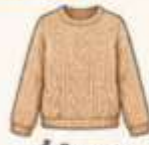
เสื้อไหมพรม