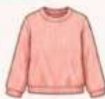
เสื้อสเวตเตอร์ถัก หรือคาร์ดิแกน