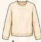
เสื้อแขนยาว