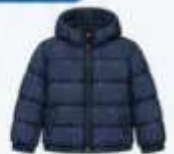
เสื้อขนเป็ด