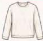
เสื้อแขนยาว