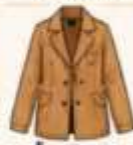
เสื้อแจ็กเก็ต หรือโค้ทตัวยาว