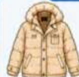
เสื้อโค้ทกันหนาวตัวหนา