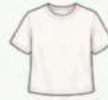
เสื้อยืด