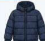
เสื้อขนเป็ด