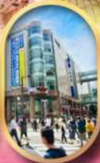
ช้อปปิ้งย่านกินจิน