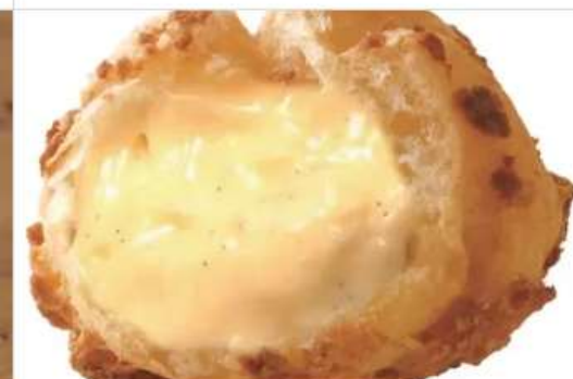
Gourmet Beard Papa