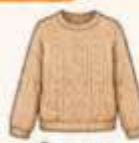
เสื้อไหมพรม