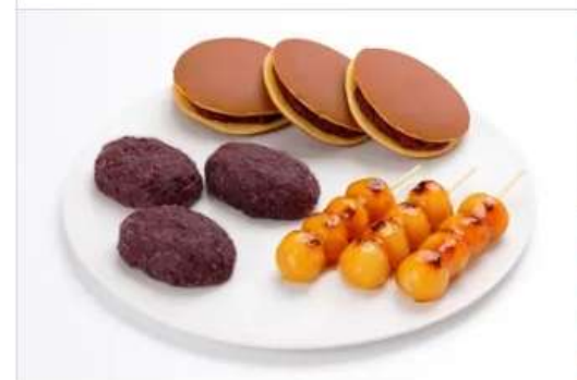
Gourmet KAKIYASU Kofukudo