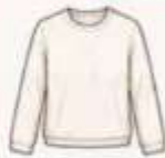
เสื้อแขนยาว