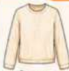
เสื้อแขนยาว