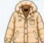
เสื้อโค้ทกันหนาว ตัวหนา