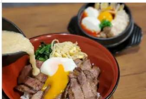
Gourmet MUGITORO & HAN