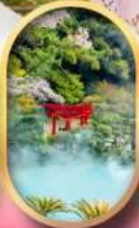
อุมิจิกุ