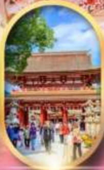
ศาลเจ้าคาไซฟู