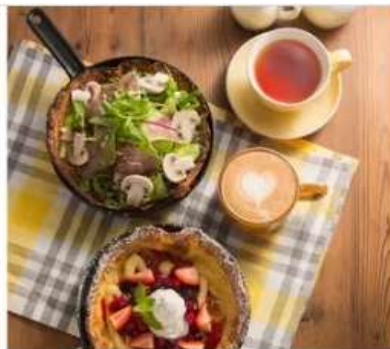
Gourmet Grace Garden Nature