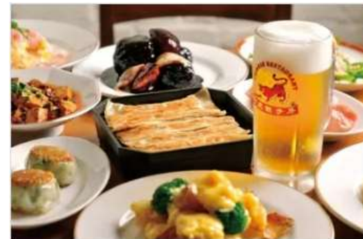
Gourmet BENITORA GYOZABOU

นำท่านเดินทางสู่ AEON TOWN SHOPPING MALL ท่านสามารถอิสระซื้อสินค้าทั่วไปของญี่ปุ่นเช่น ขนม, อาหารว่าง, ของเล่น, กระเป๋า, รองเท้า, เสื้อผ้า