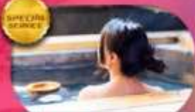
ที่พักดี อาหารดี