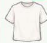
เสื้อยืด