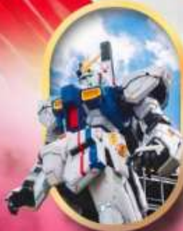
ห้างลาซาฟอกกันดั้ม