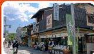
ช้อปปิ้งถนนสายชาเขียว