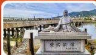
สะพานอูจิ