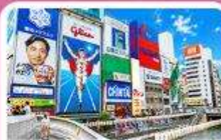
ชิบโซนาชิ