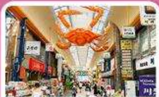
ตลาดคูกุโรม

เดินทาง 03 - 07 ก.ค. 69 | 19 - 23 ส.ค. 69 | 25 - 29 ก.ย. 69