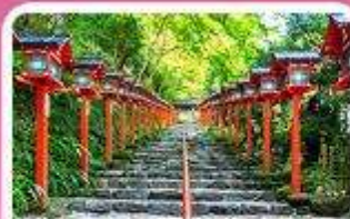
ศาลเจ้าคิฟูเนะ