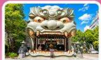
ศาลเจ้านิมบะ ยาซากะ