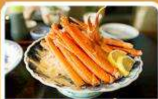
พิเศษ! ซาปู