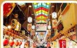
ตลาดปลาฮิชิ