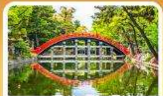
ศาลเจ้าสุมิโยชิ โกเบ