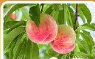
กิจกรรมเก็บผลไม้