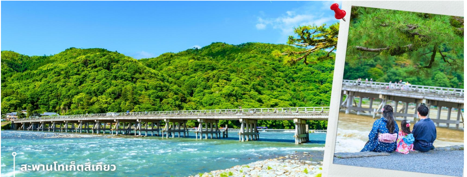
สะพานโทเก็ตสึเคียว

จากนั้นนำท่านสู่ สะพานโทเก็ตสึเคียว ตั้งอยู่ในบริเวณอารายาม่า จังหวัดเกียวโต เป็นสะพานข้ามแม่น้ำคัตสึระ (Katsura River) ตัวสะพานโทเก็ตสึเคียวดั้งเดิมนั้นเป็นสะพานไม้ทั้งหมด สร้างขึ้นในปี ค.ศ. 836 ส่วนสะพานที่เห็นในปัจจุบันนั้นสร้างขึ้นเมื่อปี ค.ศ. 1934 มีความยาว 155 เมตร และความกว้าง 12.2 เมตร โดยมีการสร้างให้ช่วงฐานเป็นคอนกรีตเสริมเหล็ก แต่ยังคงใช้ราวสะพานไม้เพื่อกองเอกลักษณ์ดั้งเดิมไว้ที่สะพานแห่งนี้ ท่านจะได้สัมผัสบรรยากาศธรรมชาติที่รายล้อมไปด้วยต้นไม้เขียวชะอุ่ม ทั่วบริเวณโดยรอบสุด อากาศอันสดชื่น และชมวิวธรรมชาติที่งดงามอย่างเต็มที