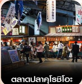
ตลาดปลาคุโรชิโอะ