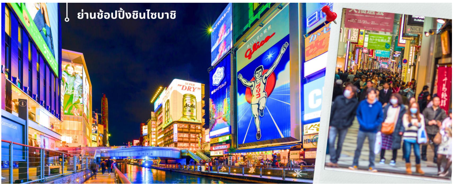
ย่านช้อปปิ้งชินไซบาชิ

สมควรแก่เวลานำท่านเดินทางสู่ ย่านช้อปปิ้งชินไซบาชิ Shinsibashi ชื่อดังของโอซาก้า มีร้านค้าทั้งเก่าแก่และทันสมัย สินค้าหลากหลายรูปแบบสำหรับเด็กและผู้ใหญ่ เป็นย่านแสงสีและความบันเทิงอีกแห่งหนึ่งของโอซาก้า อีกทั้งยังมีร้านอาหารขึ้นชื่อมากมาย ซึ่งเสน่ห์ที่