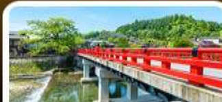
สะพานนากะบาชิ ทาดายามา