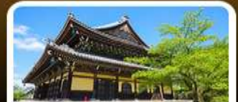
วัดนันเซ็นจิ