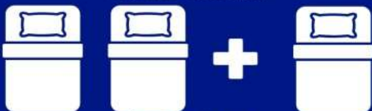
ห้องพักสำหรับสามท่าน (ที่นอนเสริม) TRIPLE BED ROOM (TRP)