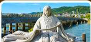
เมืองอูจิ สวรรค์คนรักชาเขียว

คาบิโดจิ สวรรค์บนดินแห่งเกือกเขาแอลป์ ชมสะพานคัปปาบาชิ ชมวัดเคียวโดอิน • เมืองกาคายามา • ตลาดปลาชิชิ • ช้อปปิ้งชินไซบาชิ • อีออนมอลล์