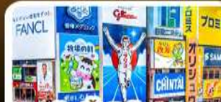
ช้อปปิ้งชินไซบาชิ และโดดงโบริ