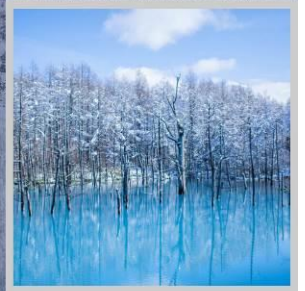
"SHIROGANE BLUE POND"