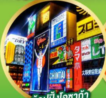
• ซุปpingโอซาก้า