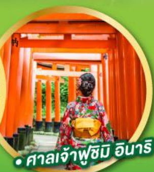
• ศาลเจ้าฟูชิมิ อินาริ

• ชมความงามของกำแพงหิมะ เส้นทางสายอัลไพน์ทาเคยาม่า (Japan Alps Snow wall)