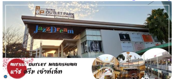
MITSUI OUTLET NAGASHIMA แจ๊ซ ดรีม เอ้าท์เล็ต

สถานที่ที่รวบรวมสินค้าแบรนด์เนม และสินค้าแบรนด์ญี่ปุ่น โกอินเตอร์มากกว่า 240 ร้านค้ามากที่สุดในประเทศ ให้ท่านได้เลือกซื้อสินค้าเสื้อผ้า อาทิ MK Michel Klein, Morgan, Ecco, United Colours of Benetton, Lacoste ฯลฯ กระเป๋า Bally, Coach, Gucci, Gap, Armani เลือกดูเครื่องประดับ และนาฬิกาอย่าง G-Shock, Seiko, Tag Heuer, Agete, S.T. Dupont, Tasaki, Longines ฯลฯ รองเท้าแฟชั่นและกีฬา Adidas, Nike, Kappa, Hush Puppies ฯลฯ และสินค้าอื่นๆ อีกมากมายซึ่งอยู่ในพื้นที่เดียวกันทั้งหมด