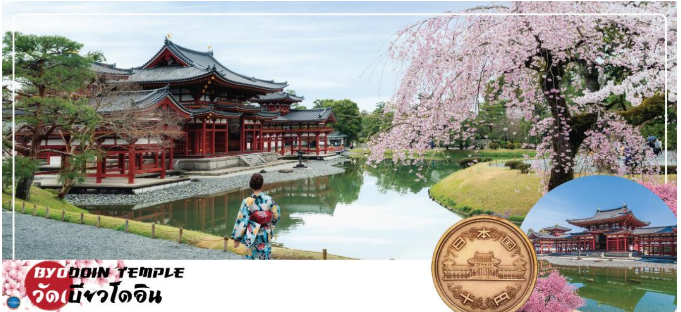
BYODOIN TEMPLE วัดเบียวโดอิน

วันที่สอง ท่าอากาศยานนานาชาติคันไซ โอซาก้า ประเทศญี่ปุ่น – เมืองเกียวโต – เมืองอุจิ – วัดเบียวโดอิน (จุดชมซากุระขึ้นกับภูมิอากาศ) – ถนนเบียวโดอิน โอโมเตะซันโด (ถนนซาเซียว) – สะพานอุจิ – เมืองนาโกย่า – แจ๊ซ ดริม เอ๊าท์เล็ท