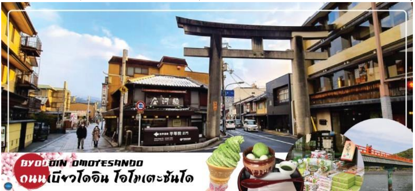
BYODOIN OMOTESANDO ถนนเบียวโดอิน โอโมเตะซันโด

จากนั้นบริเวณใกล้เคียงก็นำท่านเดินชม และช้อปปิ้ง ถนนเบียวโดอิน โอโมเตะซันโด (Byodoin Omotesando) หรือนักท่องเที่ยวชาวไทยเรียกกันติดปากว่า "ถนนชาเขียว" เพราะตลอดสองข้างทางเต็มไปด้วยร้านขนม ร้านอาหาร ที่เกือบทั้งหมดทำมาจากอุจิมัทฉะ ไม่ว่าจะเป็นชอฟครีมชาเขียว ราเม็งชาเขียว โขชะชาเขียว เกียวซ่าชาเขียว ไปจนถึงทาโกยากิชาเขียว ให้คุณได้แวะชิมลิ้มรสชาติชาเขียวอุจิต้นตำรับและยังมีขนมที่ทำจากอุจิมัทฉะให้ซื้อกลับไปเป็นของฝากได้อีกด้วย ไม่เว้นแม้แต่ตู้