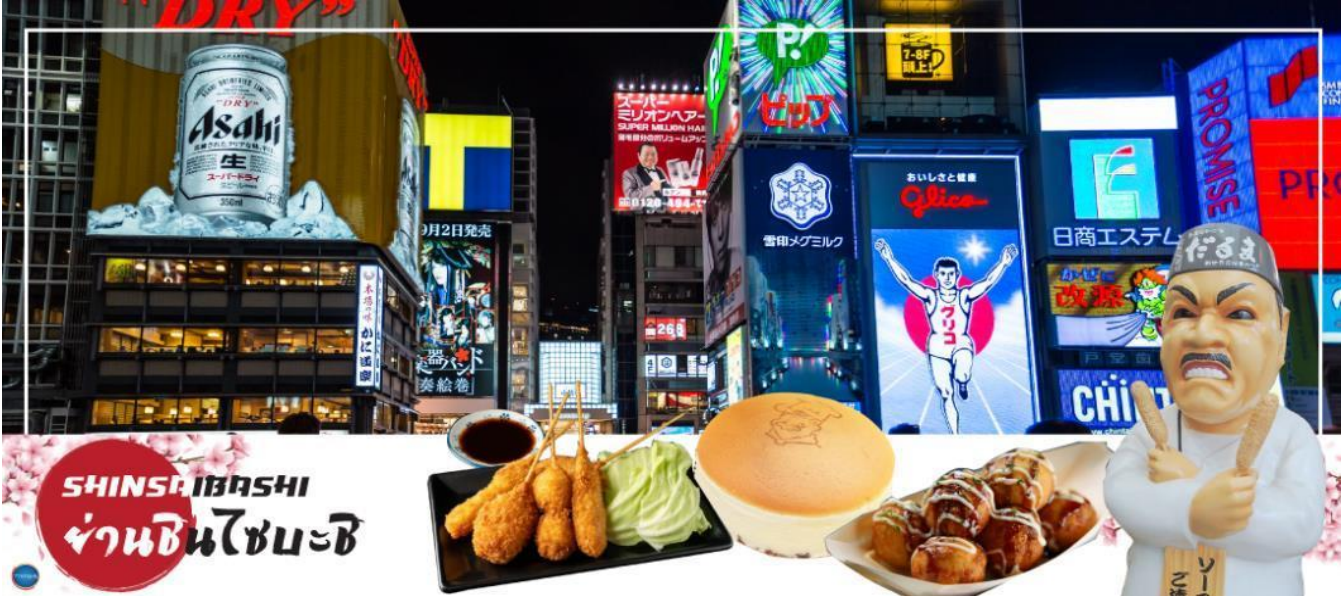
เย็น อิสระรับประทานอาหารเย็นตามอัธยาศัย

จากนั้นอิสระช้อปปิ้ง ย่านชินไซบาชิ (Shinsaibashi) (ใช้เวลาเดินทางประมาณ 30 นาที) บริเวณแหล่งช้อปปิ้งแห่งนี้มีความยาวประมาณ 600 เมตร เต็มไปด้วยร้านค้าปลีก ร้านแฟชั่นร้านเครื่องสำอางค์ ร้านรองเท้า กระเป๋า นาฬิกา ร้านกาแฟ ร้านอาหาร ร้านขนมร้านเสื้อผ้าสตรีทแบรนด์ทั้งญี่ปุ่นและต่างประเทศ เช่น Zara H&M Beans ABC Mart เป็นต้น เรียกว่ามีทุกอย่างที่ต้องการรวมกันอยู่บริเวณนี้ ใกล้กันท่านสามารถเดินไปยัง ย่านโดทงโบริ (Dotonbori) ย่านบันเทิงยามค่ำดินตลอดแนวถนนเลียบบคลองโดทงโบริ จากสะพานโดทงโบริบาชิไปจนถึงสะพานนิปปอนบาชิ ไฮไลท์!!!ใครๆก็เซ่คอิน ถ่ายภาพคู่ ป้ายกูลิโกะแมน หรือ ป้ายโดทงโบริกูลิโกะ (Dotonbori Glico Sign) เป็นป้ายไฟนีออนรูปนักกรีฑากำลังวิ่งอยู่บนลู่วิ่ง ซึ่งถูกติดตั้งมาตั้งแต่ ปีค.ศ.1935นอกจากนี้ยังมีอีกหนึ่งสัญลักษณ์สถานที่นัดพบกันหลง นั่นก็คือ ร้านปูคานิดอรากุ (Kani Doraku) ซึ่งมีปูยักษ์ขยับแขนและลูกตาได้อีกด้วย และห้ามพลาดสำหรับ ทาโกะยากิอาหารท้องถิ่นของชาวโอซาก้าที่มาถึงถิ่นแล้วต้องลอง Original Taste รับรองไม่ผิดหวังแน่นอน