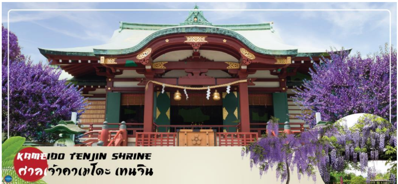
KAMEIDO TENJIN SHRINE ศาลเจ้าคาเมโตะ เทนจิน

วันที่สี่ กรุงโตเกียว – ศาลเจ้าคาเมโตะ เทนจิน (จุดชมดอกวิสทีเรียขึ้นอยู่กับสภาพอากาศ) – โทโยสุ เซนเคียวค บันไร – ชมแมวยักษ์ 3 มิติ พร้อมช้อปปิ้งย่านชินจูกุ – เมืองนาริยะ