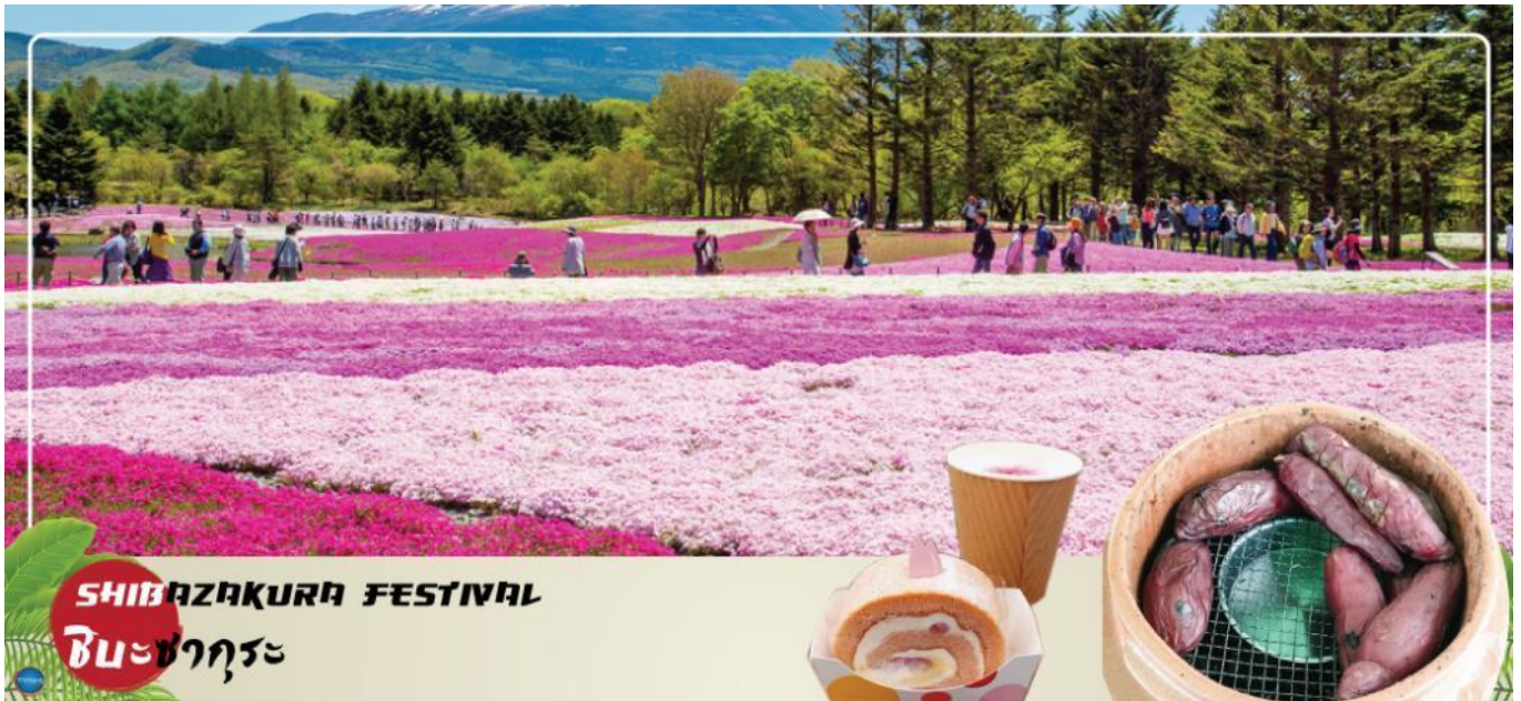
SHIBAZAKURA FESTIVAL ชิบะซากุระ

วันที่สาม เมืองยามานาชิ – เทศกาลชิบะซากุระ 2025 – พิธีชงชาญี่ปุ่น – กรุงโตเกียว – ย่านโอไดบะ – ห้างไดเวอร์ซิตี – เมืองนาริตะ