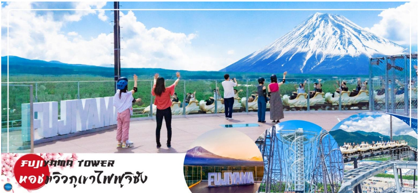
FUJIYAMA TOWER หอคอยวิวภูเขาไฟฟูจิซัง

จากนั้นนำท่านเดินทางสู่ FUJIYAMA TOWER (ใช้เวลาเดินทางประมาณ 30 นาที) เป็นหอคอยชมวิวที่ทางสวนสนุก Fuji-Q Highland สร้างขึ้นเนื่องในโอกาสที่รถไฟเหาะ Fujiyama ครบรอบ 25 ปี โดยสร้างขึ้นที่ด้านในสวนโค้งของรางรถไฟเหาะ Fujiyama ซึ่งเป็นจุดที่สามารถมองเห็นวิวของภูเขาไฟฟูจิได้เต็มตา หอคอยชมวิวแห่งนี้มีความสูงอยู่ที่ 55 เมตร โดยบริเวณชั้นบนสุดของหอคอยได้ถูกสร้างเป็นดาดฟ้าชมวิวแบบ 360 องศา ซึ่งมีชื่อว่า "Fujiyama Sky Deck Observatory" สามารถขึ้นไปเพื่อชมวิวของภูเขาไฟฟูจิได้โดยไม่ต้องนั่งรถไฟเหาะ นอกจากนี้ภายในหอคอยยังมีกิจกรรมสำหรับผู้ชื่นชอบความหวาดเสียว นั่นก็คือ "Fujiyama Walk" ซึ่งเป็นทางเดินวงกลมรอบหอคอยที่ไม่มีราวจับ จะมีก็เพียงสายรัดที่ยึดเอาไว้กับตัวเท่านั้น และอีกอย่างคือ "Fujiyama Slider" สไลเดอร์แบบท่อที่จะสไลด์ลงจากชั้นดาดฟ้าชมวิวลงสู่พื้นดิน