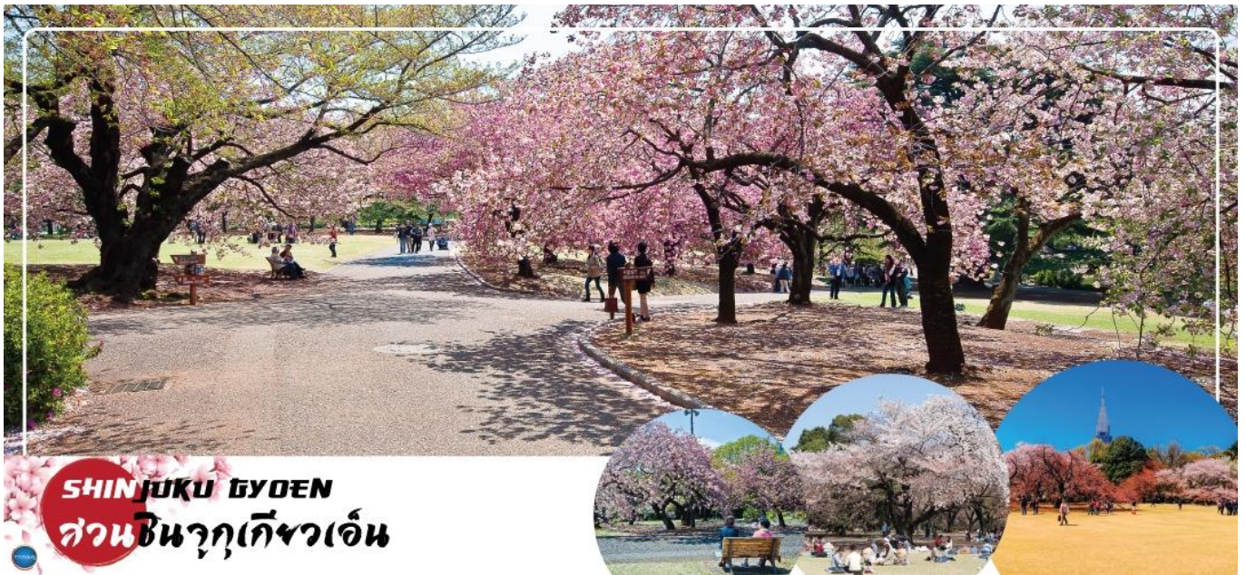
SHINJUKU GYOEN สวนชินจูกุเกียวเอ็น

วันที่สี่ เมืองนาริตะ – กรุงโตเกียว – สวนชินจูกุเกียวเอ็น (จุดชมซากุระชั้นกับภูมิอากาศ) – ศาลเจ้าเมจิ – โทโยสุ เซนเคียวคุ บันไร – ย่านโอไดบะ – ห้างไดเวอร์ซิตี – เมืองนาริตะ