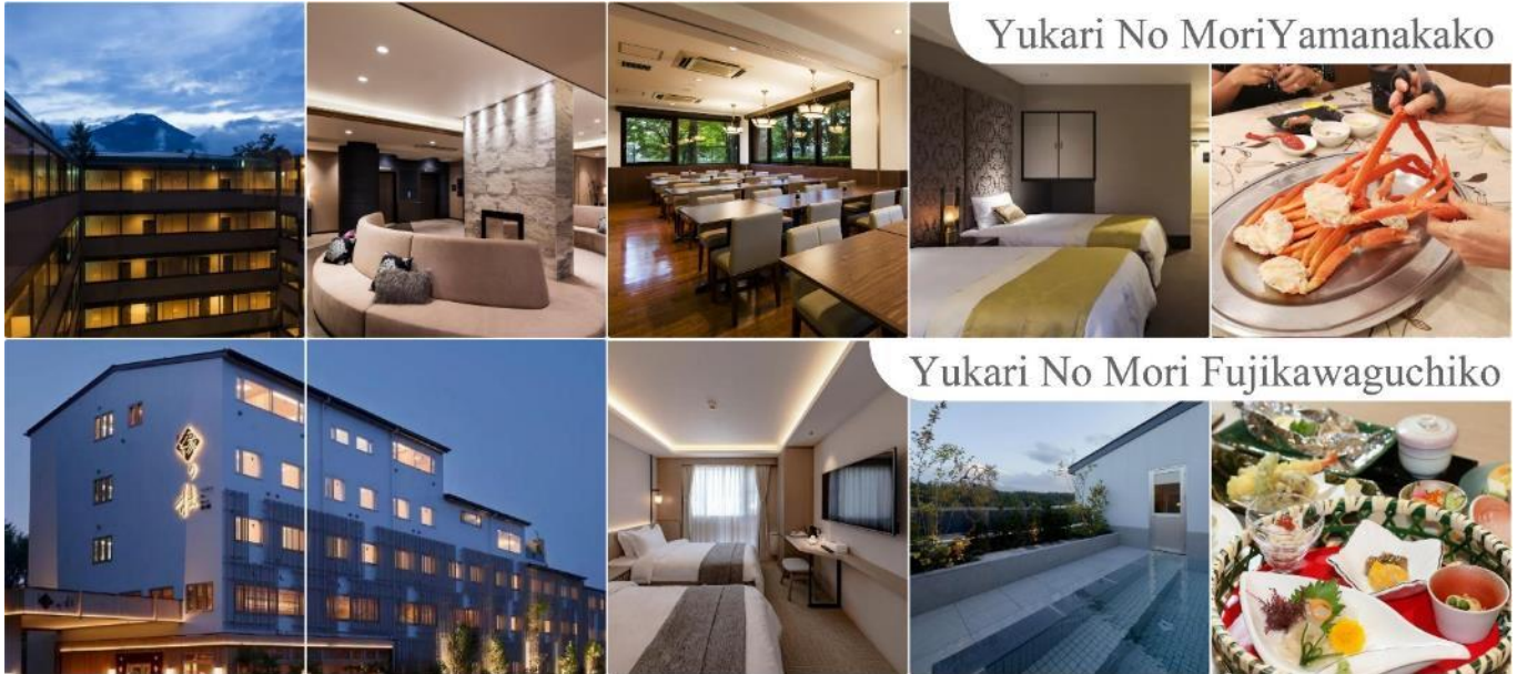
Yukari No Mori Yamanakako

หลังอาหารให้ท่านได้ผ่อนคลายกับการแช่น้ำแร่ธรรมชาติ เชื่อว่าถ้าได้แช่น้ำแร่แล้ว จะทำให้ผิวพรรณสวยงามและช่วยให้ระบบหมุนเวียนโลหิตดีขึ้น