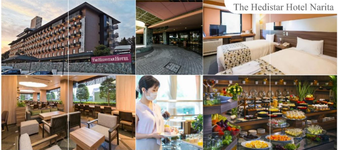
The Hedistar Hotel Narita

THE HEDISTAR HOTEL NARITA หรือระดับเดียวกัน