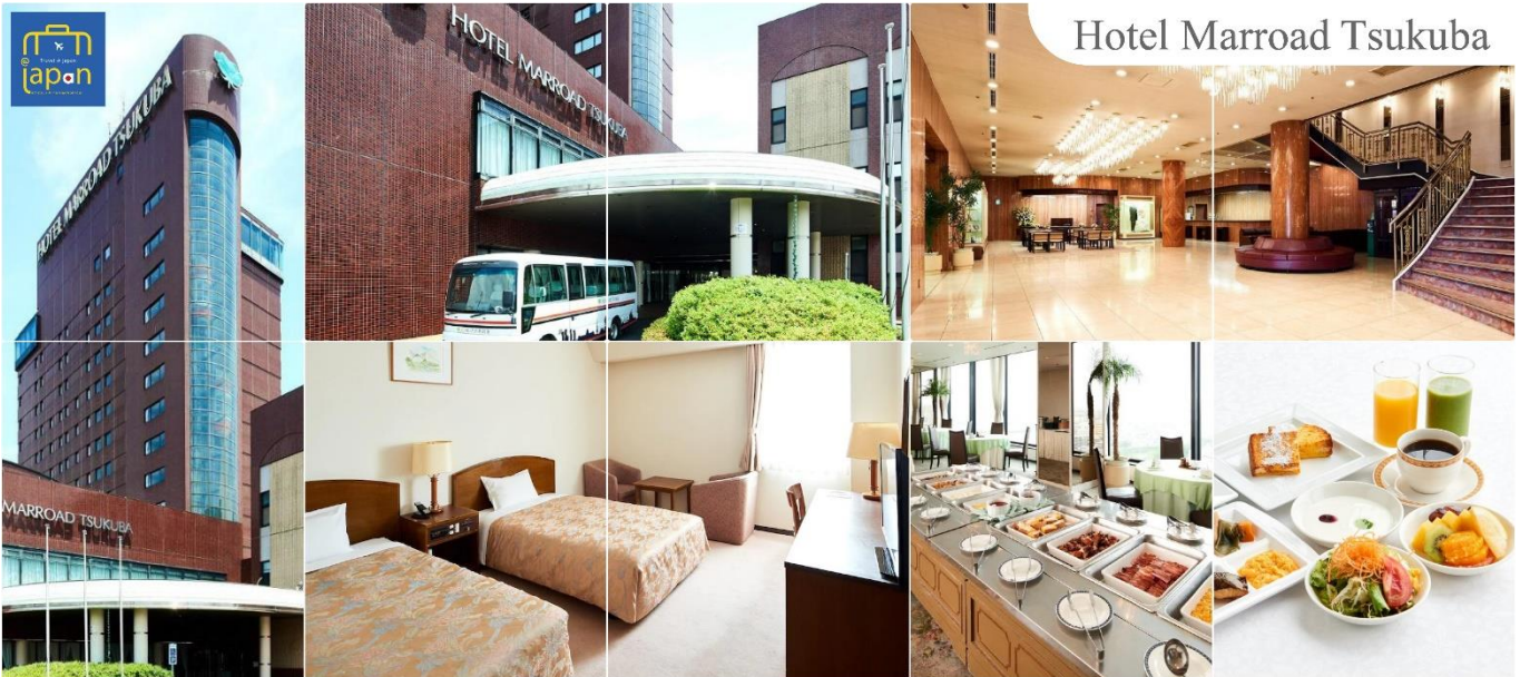
Hotel Marroad Tsukuba

รับประทานอาหารเย็น ณ ภัตตาคาร (2) HOTEL MARROAD, TSUKUBA หรือระดับเดียวกัน