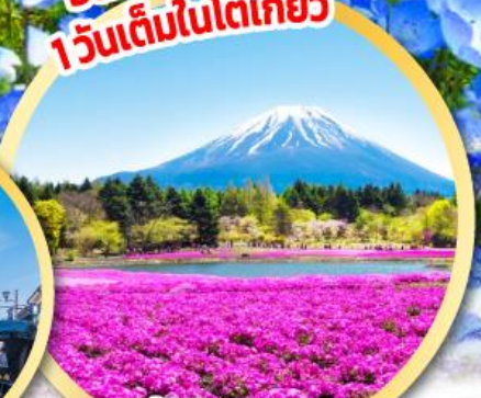
ฟูจิชิบะซากุระ เฟสทีวัล

ทัศนียภาพบนเนินเขามิฮาราชิ สวนฮิตาชิ ซีไซด์ พาร์ค ฟูจิ ชิบะ ซากุระ เฟสทีวัล (Pinkmoss)