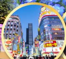
ซ้อปิ้งชินจูกุ