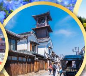
คาวาโกเอะ