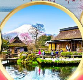
หมู่บ้านน้ำใสโอชิโนะฮักโก