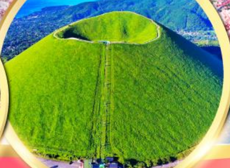
ภูเขาโอโมโระ