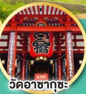
วัดอาซากุสะ