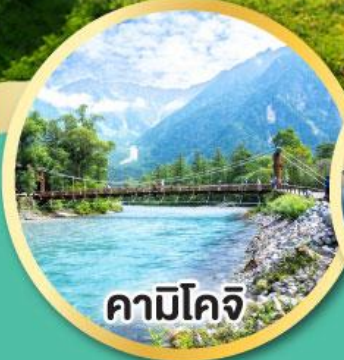
คามิโคจิ