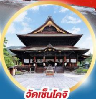
วัดเซ็นโคจิ