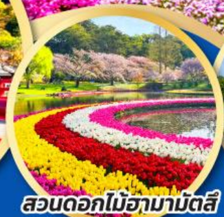
สวนดอกไม้ฮามามัตสึ