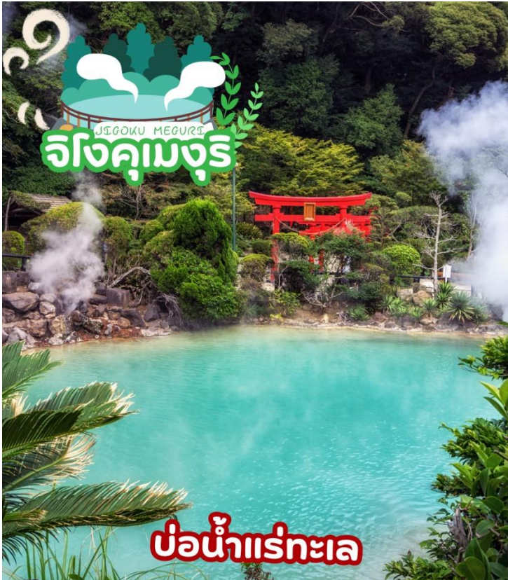
บ่อน้ำแร่ทะเล