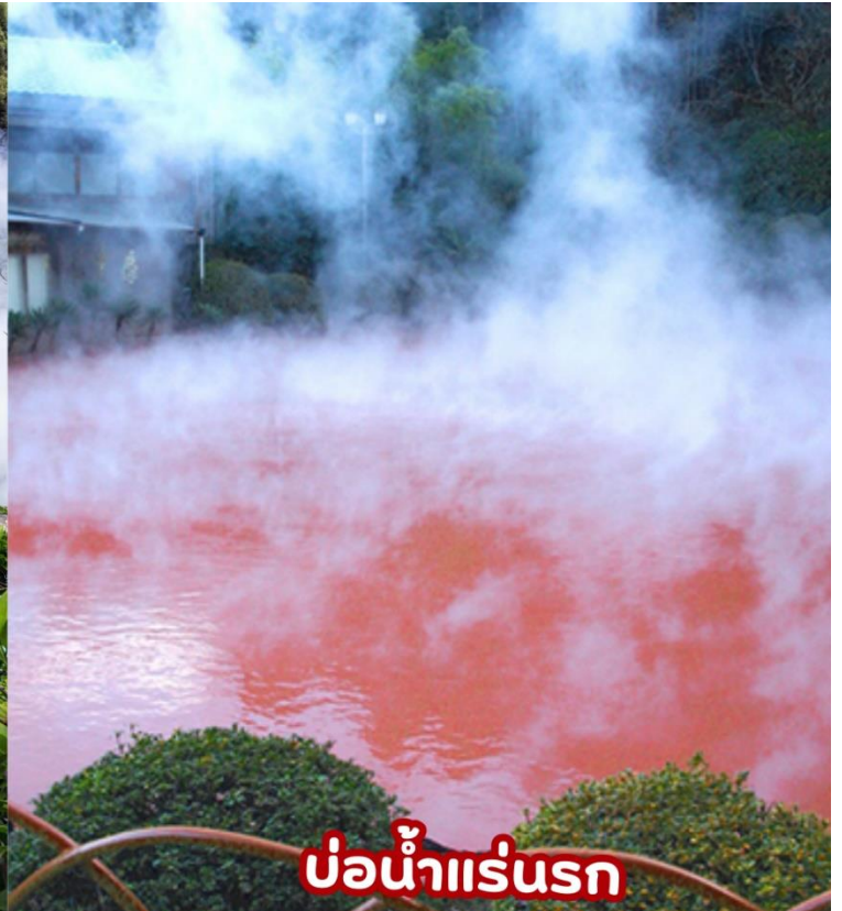
บ่อน้ำแร่รกร

ชม จิโงคุเมงูริ (JIGOKU MEGURI) ซึ่งประกอบไปด้วยบ่อน้ำแร่สีสันแปลกตาทั้งหมด 8 บ่อ (ไกด์จะพาท่านเยี่ยมชม 2 บ่อ) ที่เกิดจากการรังสรรค์ขึ้นโดยธรรมชาติแต่ละบ่อมีความร้อนสูงเกินกว่า 100 องศาเซลเซียส ด้วยสีสันและความร้อนชนิดที่มนุษย์ธรรมดาไม่อาจลงไปสัมผัสได้ จึงถูกกล่าวขานว่าเป็นเสมือน “บ่อน้ำแร่รกร” ดังนั้น ที่นี่จึงมีตัวมาสคอตเป็นยมทูตน้อยคอยให้การต้อนรับทุกคนที่มาเยือนสถานที่แห่ง