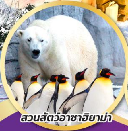
สวนสัตว์อาซาฮิยาม่า