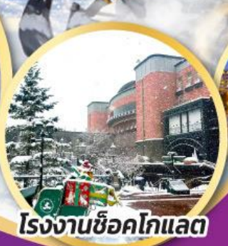
โรงงานช็อกโกแลต