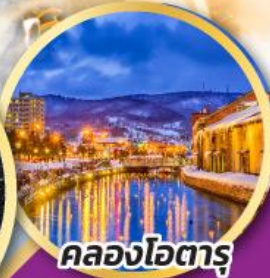
คลองโอตารุ