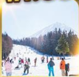
ลานสกีฟูจิเท็น