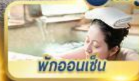
พักผ่อนเซ็น