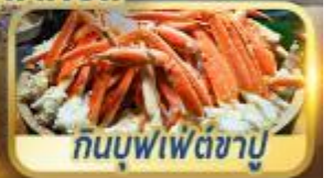
กินบุฟเฟ่ต์ชาบู