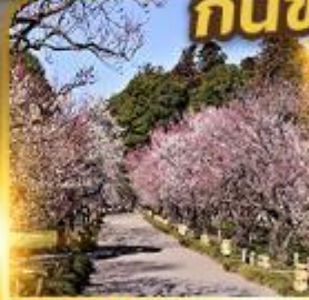
สวนโคราคูเอน