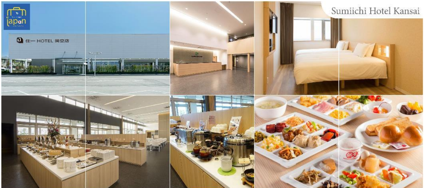
Sumiichi Hotel Kansai

SUMIICHI HOTEL KANSAI หรือเทียบเท่าระดับเดียวกัน (โดยรถบัสโรงแรม)