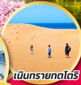
เป็นทรายทตโตริ