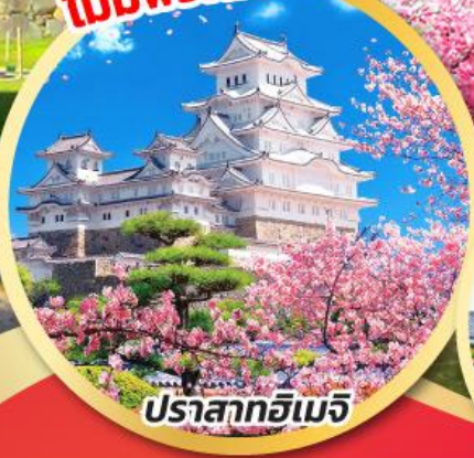
ปราสาทอิมิจิ