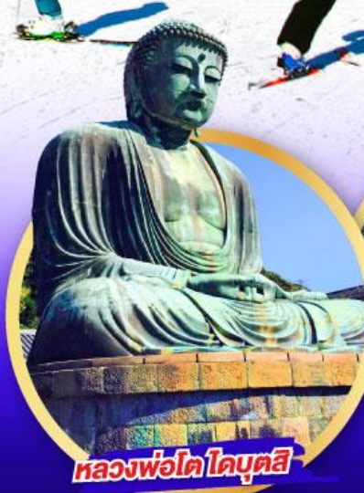
หลวงพ่อดาไคบุตสึ