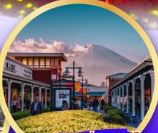
โกเทมบะพรีเมียมฮิลส์

เดินทาง 14-19 ม.ค. 68 21-26 ม.ค. 68 28 ม.ค.-02 ก.พ. 68