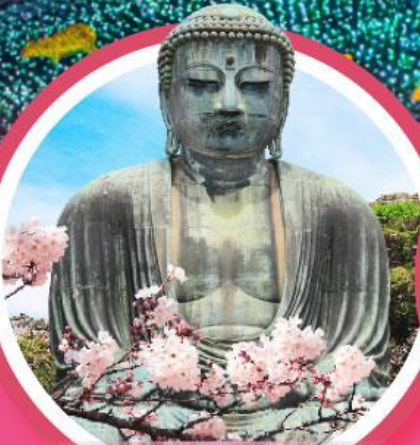
หลวงพ่อดโตโดบุตสึ