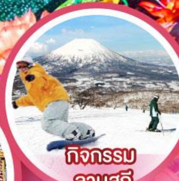
กิจกรรม ลานสกี