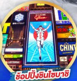
ซอปปิงชินโซบาชิ