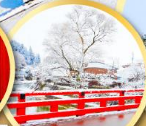
สะพานนากะบะชิ