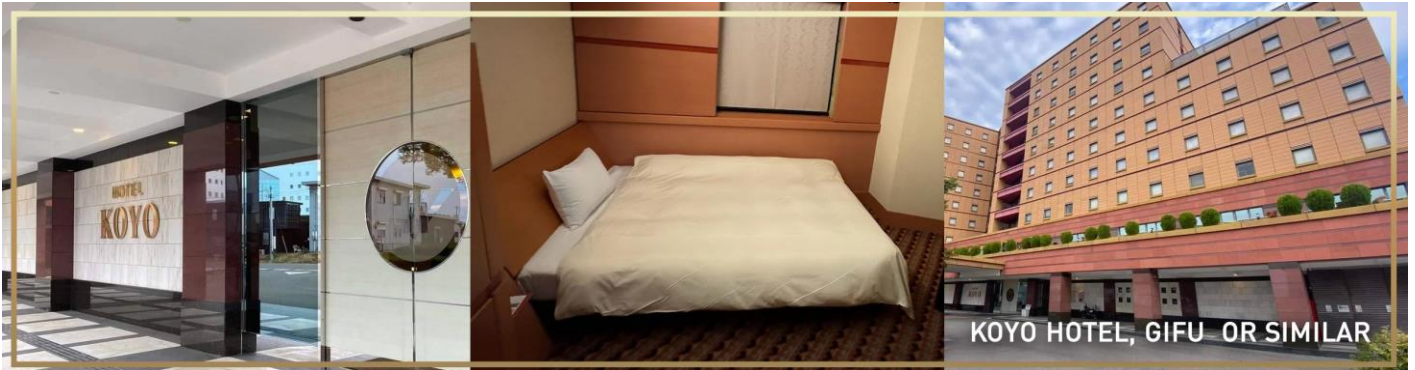
KOYO HOTEL, GIFU OR SIMILAR

วันที่ 3 หมู่บ้านชิราคาวาโกะ – ทาคายาม่า – เขตเมืองเก่าซันมาชิซึจิ