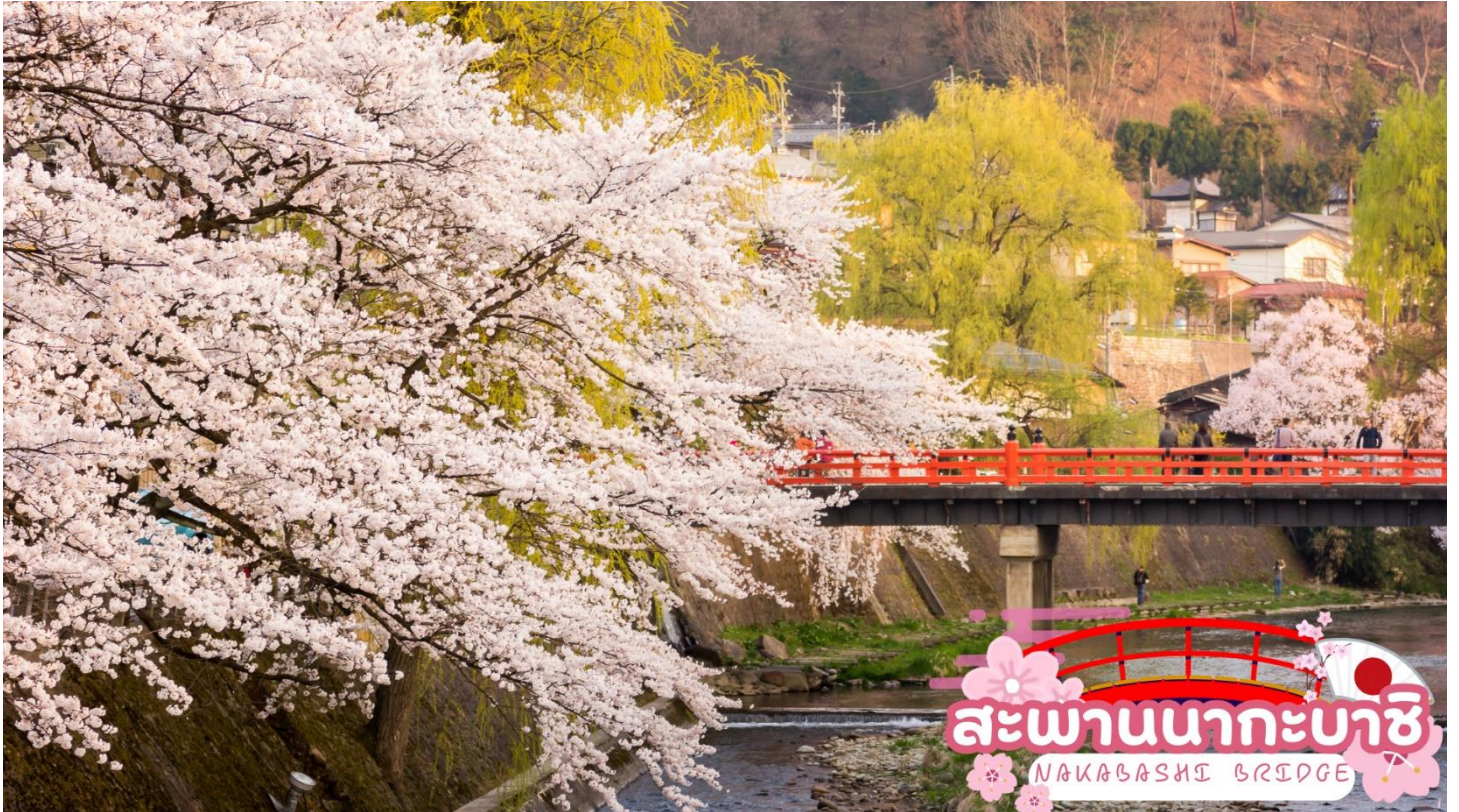
สะพานนากะบะชิ NAKABASHI BRIDGE