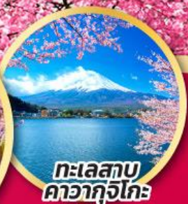
ทะเลสาบคาวากูจิโกะ