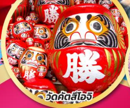
วัดคิตสึโอจิ