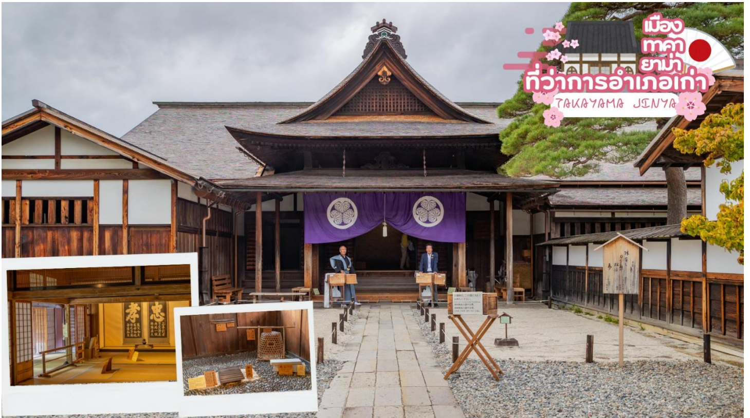
เมือง ทาคายามา ที่ว่าการอำเภอกะทัง TAKAYAMA JINYA

ผ่านชม ทาคายามา จินยะ หรือ ที่ว่าการอำเภอกะทังเมืองทาคายามา (ไม่รวมค่าเข้าชม) ซึ่งเป็นจวนผู้ว่าแห่งเมืองทาคายามา เป็นที่ทำงานและที่อยู่อาศัยของผู้ว่าราชการจังหวัดฮิเดะ เป็นเวลากว่า 176 ปี ภายใต้การปกครองของโชกุนตระกูลกุกาวา