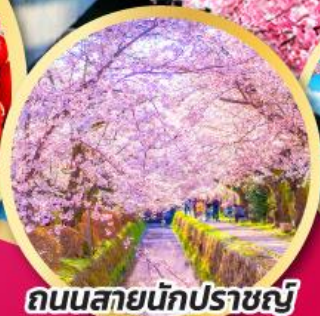
ถนนสายนักปราชญ์