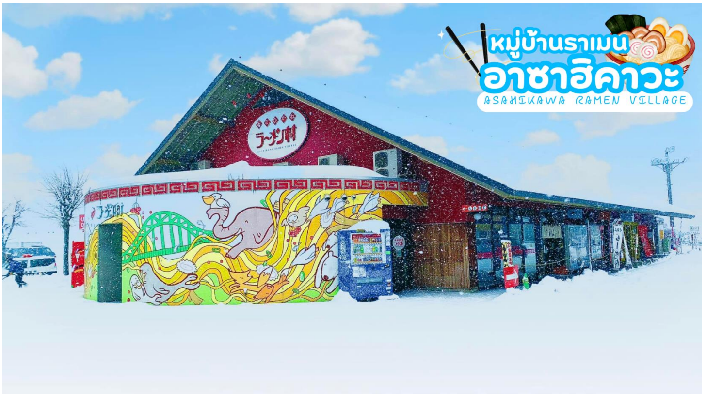
นำท่านลิ้มลองราเมนต้นตำรับแท้สไตล์ฮอกไกโดที่ หมู่บ้านรามเอนอาซาฮิคาเวะ (Asahikawa Ramen Village) ราเมนของที่นี่มีรสชาติอันเป็น

เดินทางสู่ เมืองอาซาฮิคาเวะ เป็นเมืองที่ใหญ่เป็นอันดับสองของเกาะฮอกไกโด รองจากนครซัปโปโรมีร้านค้าที่ขายข้าวและผักที่ปลูกได้ในเมือง และยังมีร้านอาหารทะเลตั้งอยู่มากมาย การคมนาคมสมบูรณ์แบบ ทำให้แต่ละปีมีผู้มาท่องเที่ยวกว่า 5 ล้านคนจากทั้งในและต่างประเทศ