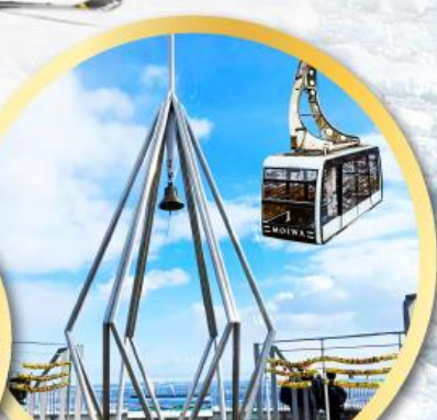
นั่งกระเช้าชมวิวเมืองซัปโปโร MT.MOIWA