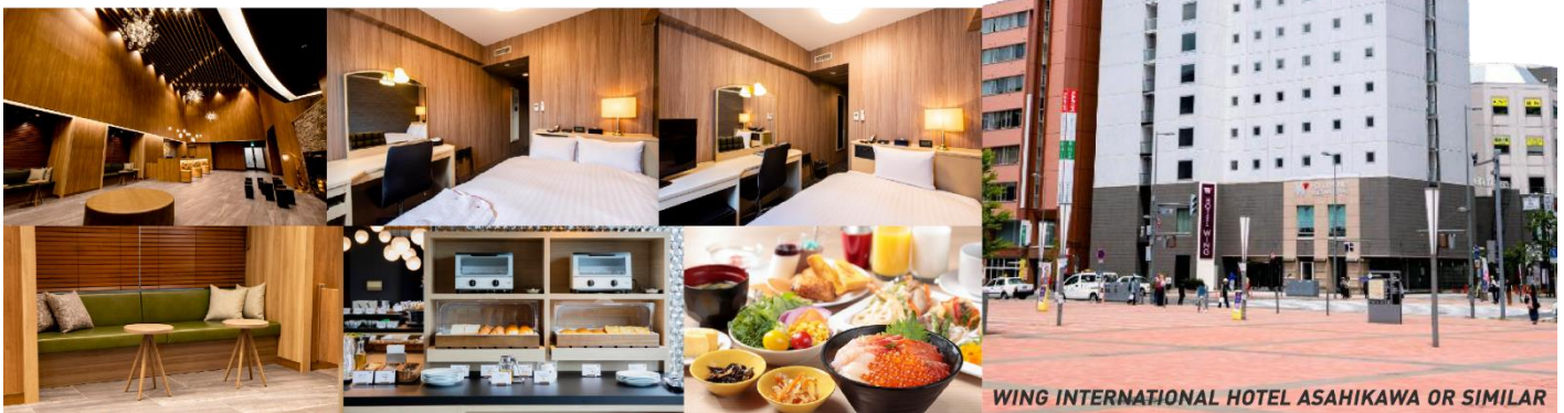
WING INTERNATIONAL HOTEL ASAHIKAWA OR SIMILAR

ที่พัก WING INTERNATIONAL HOTEL หรือ ART ASAHIKAWA, หรือเทียบเท่า