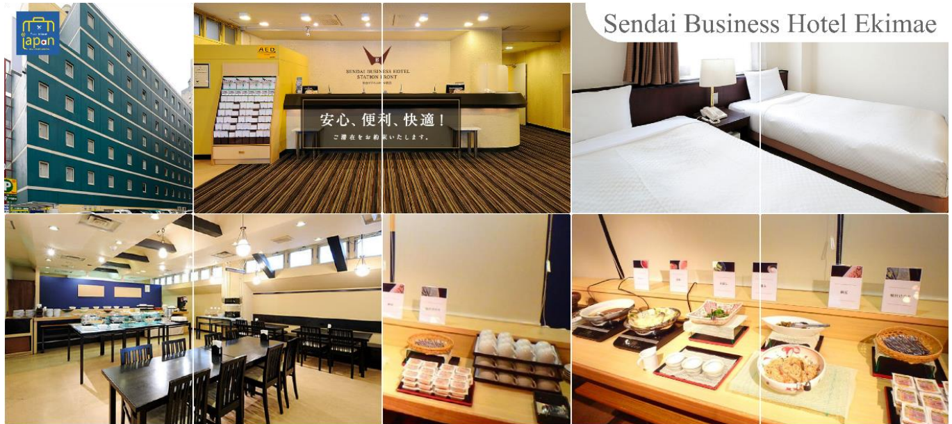
Sendai Business Hotel Ekimae

SENDAI BUSINESS HOTEL EKIMAE หรือเทียบเท่าระดับเดียวกัน