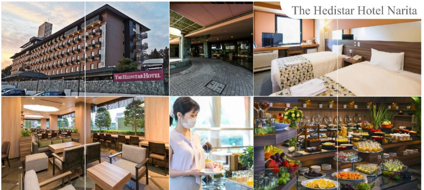
The Hedistar Hotel Narita

THE HEDISTAR HOTEL NARITA หรือระดับเดียวกัน