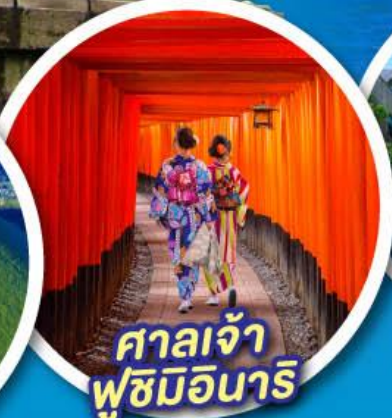
ศาลเจ้า ฟูชิมิอินาริ