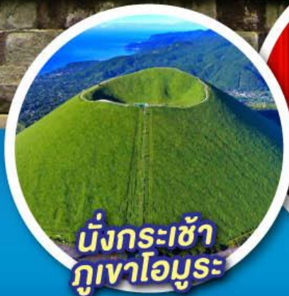
นั่งกระเช้า กุเอาโอมุระ