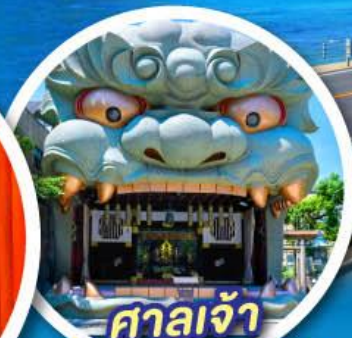
ศาลเจ้า นัมบะยาซากะ