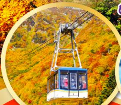
กระเช้าลอยฟ้าทาเทยาม่า

นั่งกระเช้าลอยฟ้า ชมใบไม้เปลี่ยนสีแบบพาโนรามา