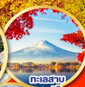
ทะเลสาบ คาวาคูจิโกะ