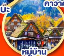
หมู่บ้าน ชิราคาวาโกะ