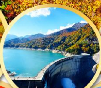
เขื่อนคุโรเบะ