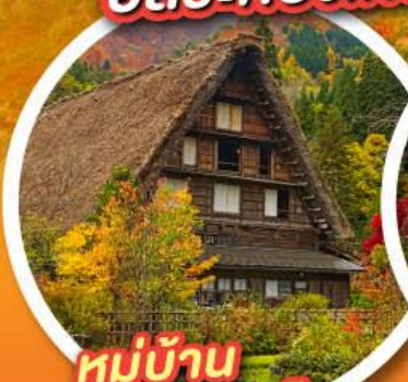
หมู่บ้าน ชิราคาวาโกะ

พักออนเซ็น 2 คืน พักโตเกียว 2 คืน อิสระท่องเที่ยว 1 วันเต็ม