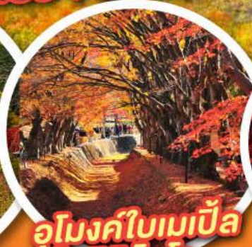
อุโมงค์ใบเมเปิ้ล โอบายาชิ โคโร