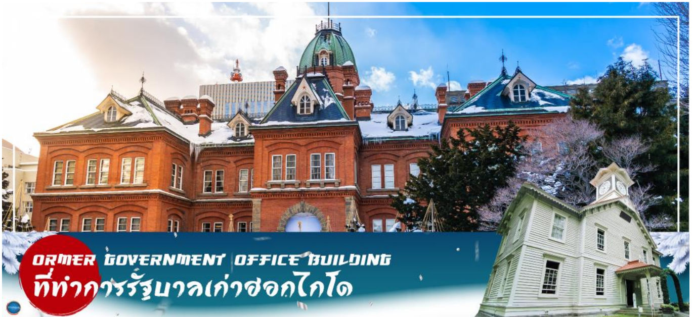
FORMER GOVERNMENT OFFICE BUILDING ที่ทำการรัฐบาลเก่าซอกไกโด

เข้าชม พิพิธภัณฑ์กล่องดนตรี (Music Box Museum) พิพิธภัณฑ์กล่องดนตรีโอตารุเป็นหนึ่งในร้านค้าที่ใหญ่ที่สุดของพิพิธภัณฑ์กล่องดนตรีในญี่ปุ่น โดยตัวอาคารมีความเก่าแก่สวยงามและถือเป็นอีกหนึ่งในสถานที่สำคัญทางประวัติศาสตร์เมือง ไฮไลท์!!! หน้าอาคารหลักของพิพิธภัณฑ์กล่องดนตรี มี นาฬิกาไอน้ำ (Steam Clock) ปัจจุบันมีเพียง 2 เรือนในโลกคือที่เมืองแวนคูเวอร์ ประเทศแคนาดา กับที่เมืองโอตารุแห่งนี้ นาฬิกาจะเล่นเพลงและปล่อยไอน้ำออกมาทุกๆ 15 นาที ถือเป็นจุดแลนด์มาร์คอีกจุดที่มาโอตารุแล้วไม่ควรพลาด นอกจากสถานที่ดังกล่าวข้างต้นนั้น ยังมีร้านขนมและร้านขายสินค้าที่ระลึกอีกมากมาย เช่น ร้านขนม LeTAO ที่ภายในนอกจากจะจำหน่ายขนมแล้วยังเป็นร้านกาแฟ ที่หากท่านเดินช้อปปิ้งมาเหนื่อยๆ สามารถแวะมาพักผ่อนจิบเครื่องดื่มพร้อมชิมขนมหวาน ณ ร้านนี้ได้ ร้าน Rokkatei โกดัง โรงงานผลิตขนมของซอกไกโด ด้านในมีจำหน่ายขนมมมเนย รวมไปถึง กาแฟ และของฝากของขึ้นชื่อของเมืองโอตารุ อีกทั้งสามารถซื้อสินค้าแบบ Tax Free ได้ด้วย และข้างๆกันยังมี ร้าน Kitakaro โกดังผลิตขนมอีกรายหนึ่ง ร้านนี้เน้นในส่วนของขนมสด อาทิ ซอฟท์ครีม เค้กต้นไม้ และขนมอบต่างๆ เป็นต้น อิสระให้ท่านเดินเล่นถนนซาโคมิจิตามอัธยาศัย